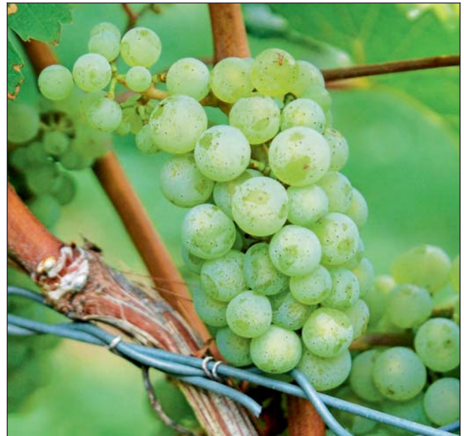
Eine Riesling-Traube auf einer der Versuchsfelder.

Aufgrund der zunehmenden weinbaulichen Maßnahmen ist die Erzeugung von