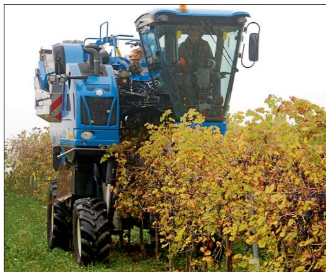
Minimalschnitt-Systeme erfordern eine maschinelle Lese.

Wechselt man dagegen zu einem weitestgehend rationalisierten Anbausystem, kann bei Riesling im mittleren Preissegment in Direktzulanlage eine Vermarktungsleistung von rund 9000 Flaschen pro Hektar erzielt werden, was die Wirtschaftlichkeit bereits stark verändert. Dabei stellt die durchgeführte Erhöhung des Ertrages pro Flächeneinheit