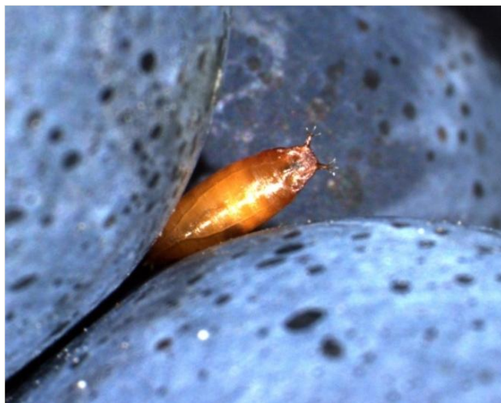
Abb. 5: Puppe mit den typischen sternförmigen Anhängen