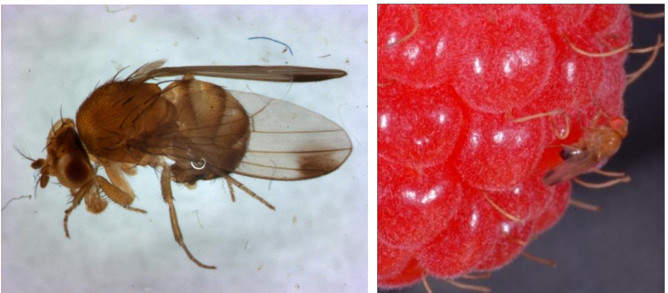
Abb. 1: Männchen der Kirschessigfliege mit den typischen Flecken auf den Flügeln

Bei Befalls-Verdacht kann Fruchtmaterial (Trauben, Wildfrüchte etc.) auch sehr leicht einige Tage in einem nur mit kleinen Luftlöchern versehenem Behältnis aufbewahrt und auf Schlupf der Fliegen untersucht werden. Die Männchen lassen sich dann, wie oben beschrieben, gut an den schwarzen Punkten auf den Flügelspitzen erkennen.