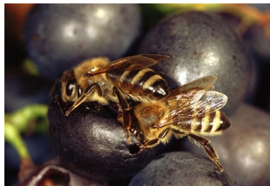
Abb. 6: Vorgeschädigte Beeren werden z.T. von Bienen befliegen; keine Ausbringung von bienengefährlichen Mitteln.

Vorbeugende Behandlungen vor dem Farbumschlag und nach der Ernte sind nutz- und wirkungslos. Nur zugelassene oder genehmigte Produkte dürfen verwendet werden und die Wartezeit ist einzuhalten. Aufgrund von Resistenzgefährdung sollten die Mittel entsprechend einem von der Beratung empfohlenen Resistenzmanagement (Wechsel der Wirkstoffe) eingesetzt werden. Besonders zu beachten ist die Bienengefährlichkeit einzelner Mittel.