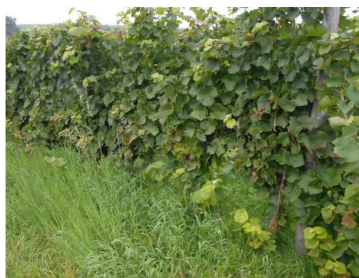
Abb. 3: Mangelnde Laubarbeiten und hoher Unterwuchs fördern die Kirschessigfliege.