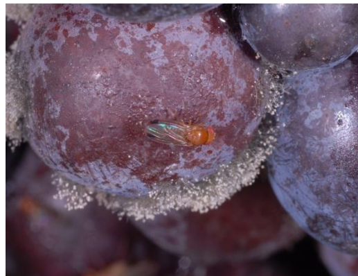
Abb. 1: Vorgeschädigte Beeren werden von Kirschessigfliegen gerne befliegen