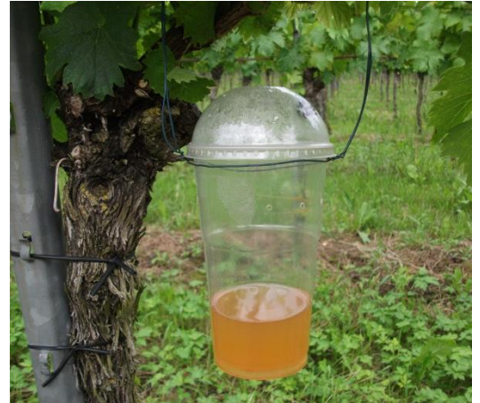
Abb. 4: Standardfalle mit Apfelessig-Wasser-Gemisch für das Fallenmonitoring.

www.vitimeteo.de/monitoring/fallenfaenge.shtml