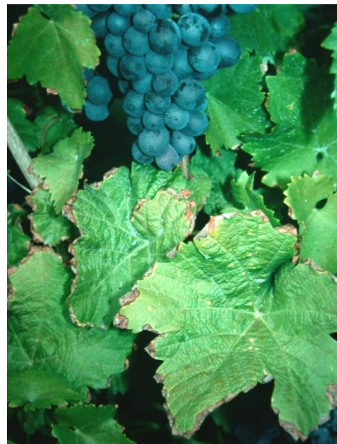
Vertrocknete Blattränder bei Kalimangel.

Die Bodenproben sollen vor einer Grunddüngung aus der Bodenschicht von 0 - 30 cm entnommen werden. Aus 0 - 60 cm Tiefe wird bei Bodenuntersuchung nach der EUF-Methode oder wenn eine tief wendende Bodenbearbeitung geplant ist entnommen. Wenn die Entwicklung der Nährstoffgehalte langfristig beobachtet werden soll, sollte die gleiche Beprobungstiefe beibehalten werden.