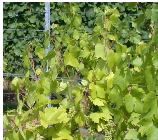
Stickstoffmangel. Schwachwüchsige Reben, hellgrüne Blätter mit roten Blattstielen, frühe Herbstverfärbung

Nach dem Umbruch einer langjährigen Begrünung oder der Einarbeitung von Leguminosen wie Winterwicke oder Kleeegrasmischungen ist keine N-Düngung notwendig. N-Mangel durch eine ungeeignete Bodenpflege oder Wassermangel lässt sich nicht durch eine überhöhte Düngung ausgleichen. Wuchsunterschiede in der Rebanlage (Magerstellen, mastige Bereiche) sollten bei der N-Düngung beachtet werden.